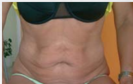
Po třetím ošetření