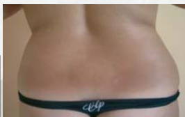
Po druhém ošetření