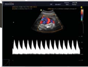
Umbilical artery in Doppler